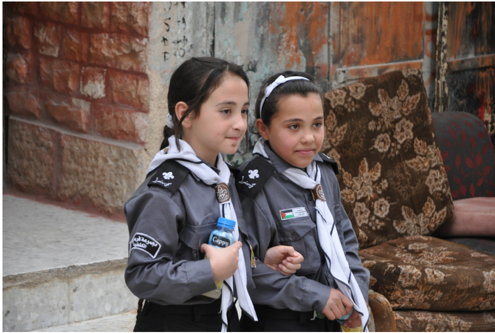
Good To Know • Wij zijn hier • Amsterdam (2012-ongoing) • www.wijzijnhier.org